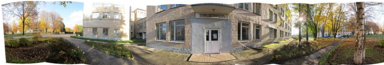
Рис. 1. Приклад панорамної фотографії

Розглядаючи будь-яку цифрову панораму в першу чергу треба розуміти, що її основним елементом є панорамна фотографія (рис. 1).