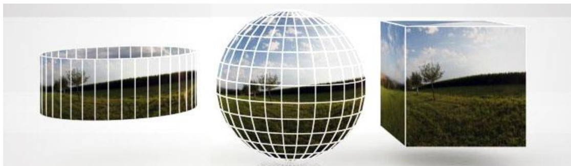
Рис. 2. Основні види цифрових панорам: циліндрична, сферична та кубічна

Для створення панорам існує спеціальний панорамний фотоапарат – фотоапарат для отримання панорамних знімків з кутом зображення, що охоплює значний сектор (від 100° до 360°