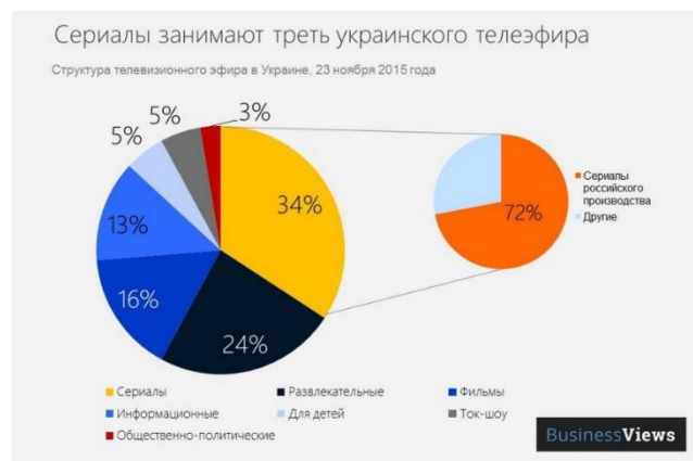
Рис. 2. Приклад інфографічного звіту компанії BusinessViews

2. Інфографічний звіт (рис. 2). Звіти будь-якої організації можуть бути величезними. Це трудомісткі проекти, які дуже часто можуть бути незатребуваними у цільовій аудиторії через їх великі розміри і нудного оформлення. Щоб позбавитися таких невдалих звітів не потрібно створювати комікс, трансформуючи в картинки кожен аспект діяльності, згаданий в звіті. Як і у випадку з чартіклами, необхідно виділити головне і ретельно спланувати візуалізацію конкретних даних. Невелика кількість яскравих інфографік вигідно розбавлять велику кількість сторінок звіту. Такий абсолютно новий формат звіту покликаний доступно пояснити, чому організація проводить непопулярні заходи і які результати це принесе в майбутньому.