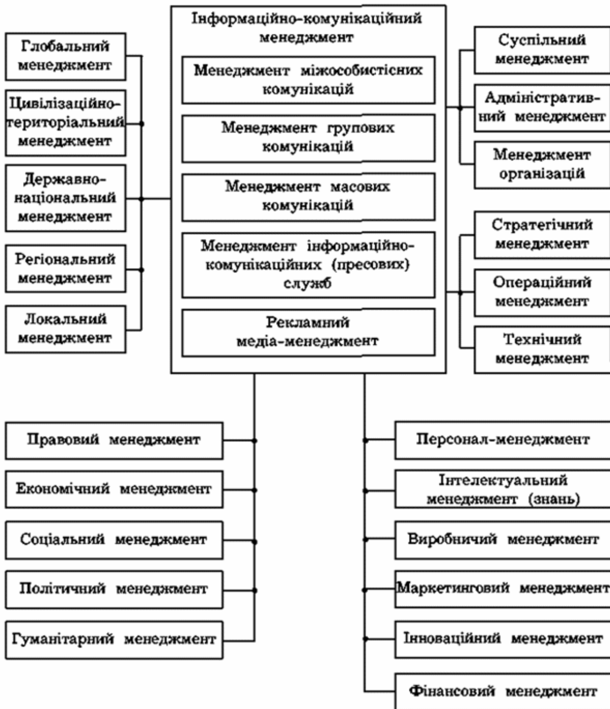
Рис. 1 Місце комунікаційного менеджменту у системі менеджменту

Активний розвиток інфокомунікаційних технологій як основи сучасних комунікаційних систем призвів до того, що вони перетворились в один з найважливіших елементів діяльності підприємств і відіграють винятково важливу роль у забезпеченні їх конкурентоспроможності. [5]