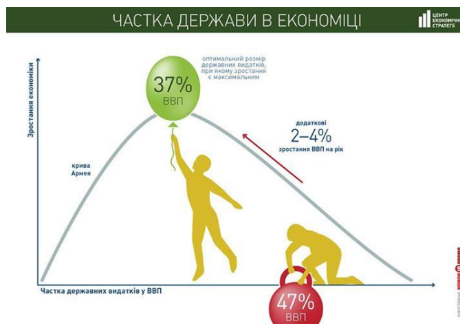
Рис. 1. Приклад чартіклу Центру економічної стратегії

поточи тексту острівців графіки утримає увагу тих, хто не дуже любить читати, але хоче бути в курсі. Таких людей буде ставати все більше.