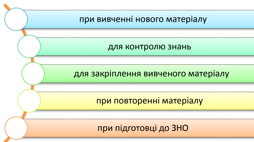
Рис. 1. Формати використання ІКТ на уроках математики

Впровадження інформаційно-комунікаційних технологій (ІКТ) в освітній процес засновано на фізіологічних даних людини: пам'ять зберігає 25% почутого матеріалу, 33% – побаченого, 50% – побаченого і почутого, і 75% матеріалу за умови активної участі учня в навчальному процесі [2]. ІКТ можна використовувати під час уроку в різноманітних форматах (рис. 1).